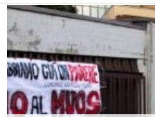
Tav, Muos e grandi opere: se la gente dice no