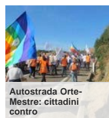
Autostrada Orte-Mestre: cittadini contro