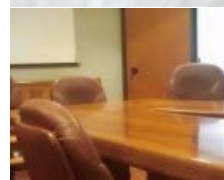
Fiumicino2, aeroporto che si gioca a dadi